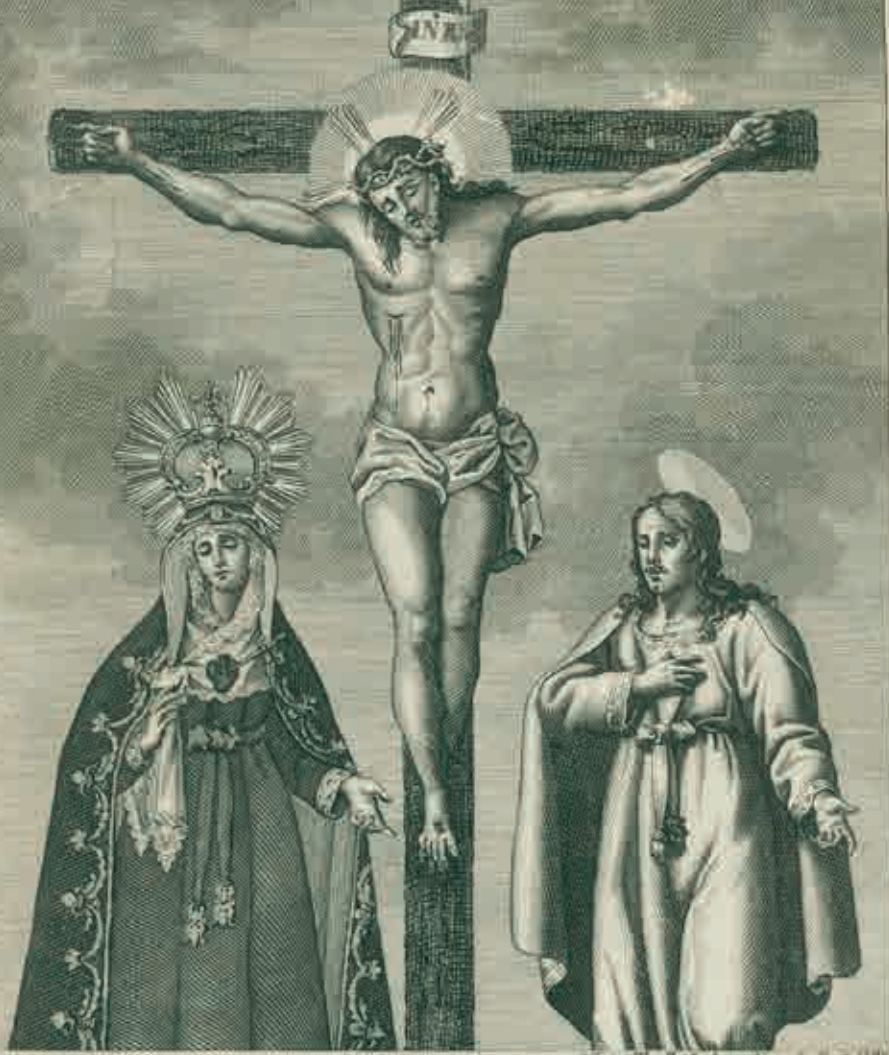
VERDADERO RETRATO DE LA MILAGROSA IMAGEN DEL SANTÍSIMO CRISTO DE SANTIAGO. Protector y Patrono de la villa de Utrera, que se venera en la Parroquia de San Mateo de dicha villa.